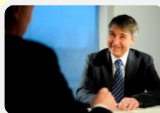
セキュアプログラミング教育 (プログラマコース)